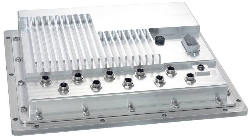
Ein neu entwickeltes Gehäuse macht die modulare Elektronik zum einbaufertigen Gesamtsystem, das dank nur 60 W Leistungsaufnahme im Vollausbau ohne aktive Lüftung oder Kühlung auskommt.